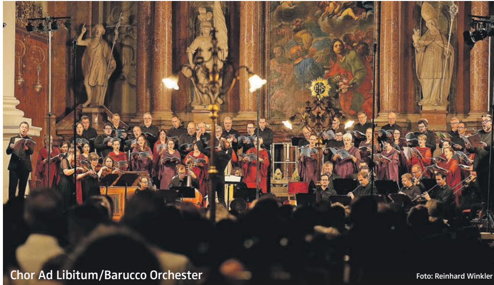
Chor Ad Libitum/Barucco Orchester

Doch. Musik beschreiben oder erklären? Fast unmöglich. Albert Einstein merkte zu Bachs Lebenswerk nur Fol-