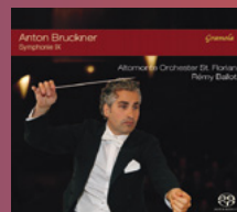
Anton Bruckner Symphonie IX St. Florianer Brucknertage 2015 Altomonte Orchester St. Florian Rémy Ballot

Supersonic Award, ICMA Nomination, CD des Jahres Ö1