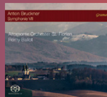
Anton Bruckner Symphonie VII St. Florianer Brucknertage 2018 Altomonte Orchester St. Florian Rémy Ballot