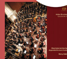
Anton Bruckner Symphonie VIII St. Florianer Brucknertage 2014 Oö. Jugendsinfonieorchester Rémy Ballot