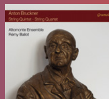
Anton Bruckner String Quintet/Quartet Altomonte Ensemble Rémy Ballot