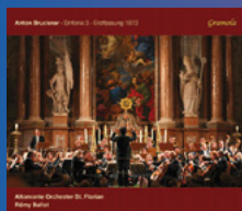
Anton Bruckner Symphonie III St. Florianer Brucknertage 2013 Altomonte Orchester St. Florian Rémy Ballot