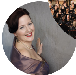
M. HANS © PRIVAT