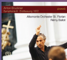
Anton Bruckner Symphonie II St. Florianer Brucknertage 2019 Altomonte Orchester St. Florian Rémy Ballot