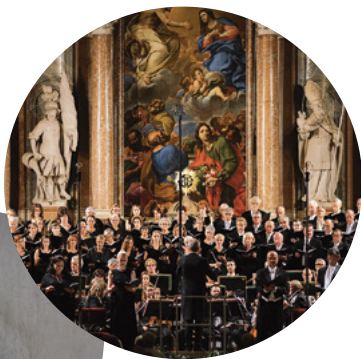
R. RIEL