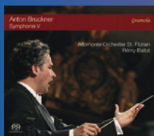
Anton Bruckner Symphonie V St. Florianer Brucknertage 2017 Altomonte Orchester St. Florian Rémy Ballot