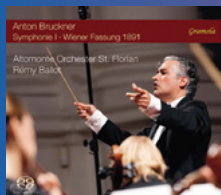
Anton Bruckner Symphonie I St. Florianer Brucknertage 2022 Altomonte Orchester St. Florian Rémy Ballot