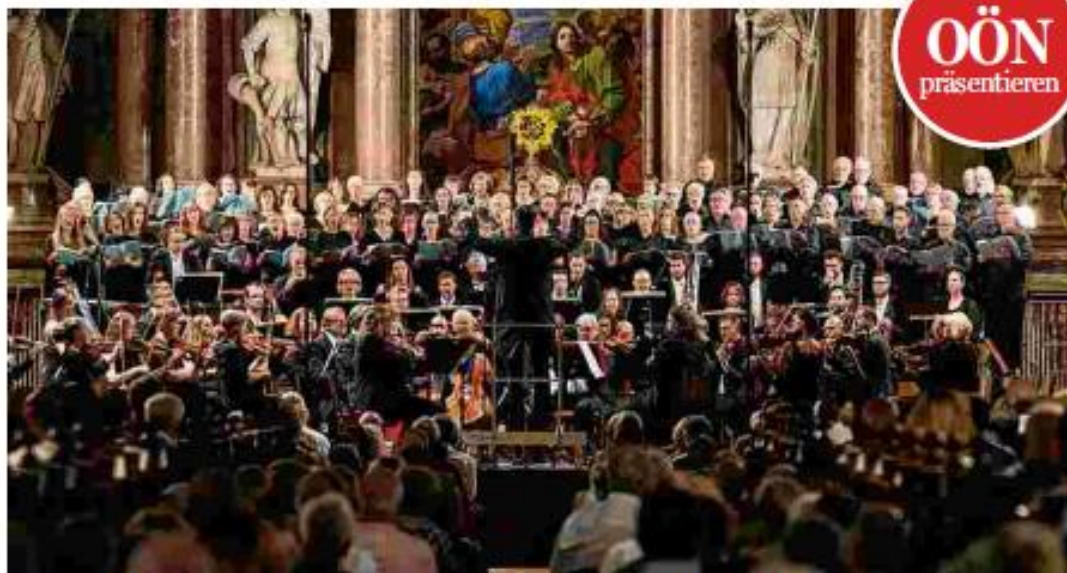
Mit der Florianer Chorakademie wurde am Beginn Bruckners „Alleluja: Lobet den Herrn“ aufgeführt.