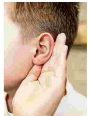
Den Tönen auf der Spur