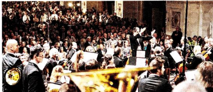
Das Altomonte Orchester spielt bei der Eröffnung am 13. August.

ST. FLORIAN. Die Brucknertage gehen heuer von 12. bis 19. August im Stift St. Florian über die Bühne. Besucher können ein abwechslungsreiches Programm rund um Anton Bruckner erwarten. Höhepunkt des Festivals ist Bruckners „Nullte“, die unter dem Motto „Aufbruch in eine neue Dimension“ in einer weltweiten Erstausführung dargeboten wird.