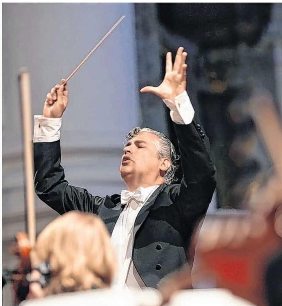
Symphoniekonzert am 19. und 20. August unter der Leitung von Rémy Balot mit dem Hard-Chor und dem Altomonte Orchester

OÖNcard-Inhaber erhalten 20% Ticket-Rabatt!