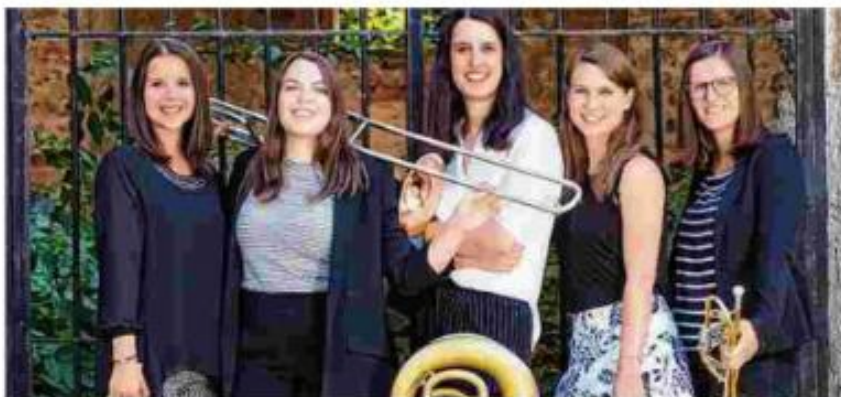
Das Ensemble „QuinTTonic“ spielt am 14. und 17. August bei den Brucknertagen.