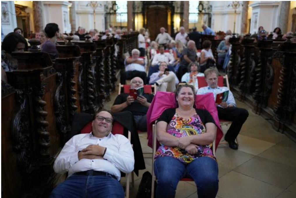
Ein Genuss für Aug und Ohr