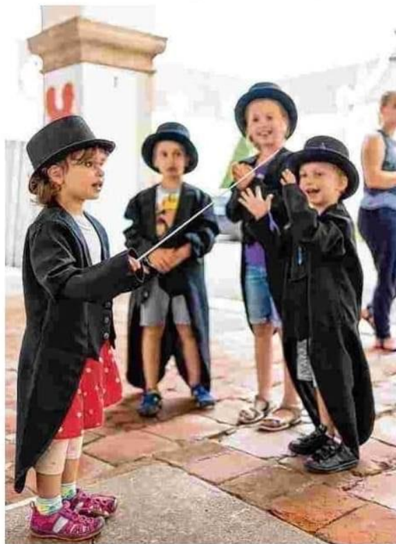
Im Stift St. Florian erfahren Kinder spielerisch mehr über Bruckner.

Zachbauer entwickelte ein Themenprogramm, in dem man das gesamte Haus in zwei Stunden sieht, wobei in jedem Raum eine