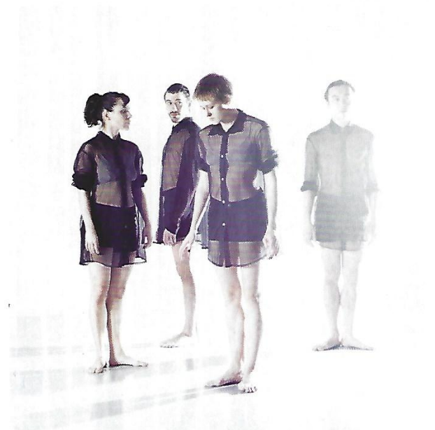
Ein Tanzensemble der ABPU tanzt Bruckners II. Symphonie im Marmorsaal des Stiftes St. Florian

»Die Klavierbearbeitung eines historischen Orchesterwerks als Bezugspunkt neuer Kompositionen zu verwenden, birgt eine große Gelegenheit in sich. Musikalische Prozesse eines großen Klangkörpers auf zwei Instrumente zu reduzieren, führt dazu, dass kleine Klänge größer gedacht und große Klänge auf ihre Essenz destilliert werden. »Antworten auf Bruckner« ist eine dreiteilige Komposition, die zwischen den vier Sätzen der vierhändigen Klavierbearbeitung