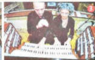
1 Heilige Atmosphäre bei großartiger Orgelmusik in der Stiftsbasilika St. Florian