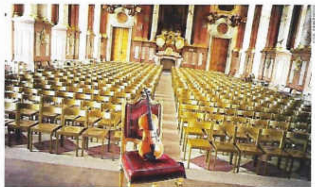
Kraftort: Das Stift St. Florian war Inspiration für Anton Bruckner und ist nun Austragungsort eines der ambitioniertesten Musik-Festivals Österreichs.

und Zeitbegriffe. Das Wesentliche der VII. ist im Stift entstanden – und hat die Welt erobert. Nun kommt die Welt als unser Gast zum Ursprung zurück. Der Kraftort Sankt Florian hat seine eigenen Dimensionen von Raum und Zeit.“