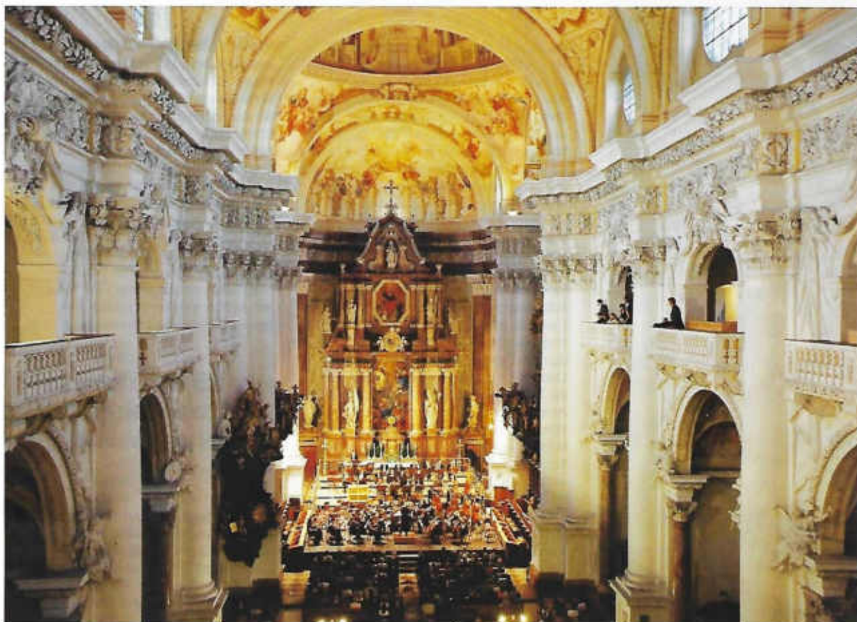
Begeisterung verbindet: Eine Woche im August ist St. Florian Treffpunkt einer interkontinentalen Bruckner-Familie.