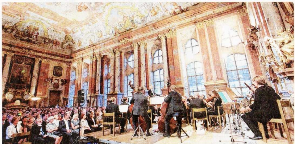
Das Altomonte-Orchester bei der Eröffnung der Brucknertage von St. Florian

Deren Wiederentdeckung würde für Bruckner und vor allem für die Musik seiner Zeit mehr leisten als eine – wenn auch tadellose – Wiedergabe der Mozart'schen Jupitersymphonie. Eines ist aller-