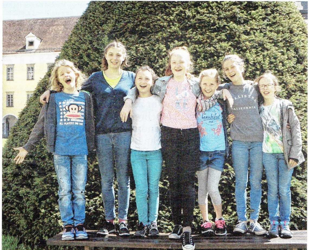
Sie laden alle ab vier Jahren zu einer gemeinsamen Zeitreise in die Jugendjahre Anton Bruckners ein.

Worum es geht? Eigentlich ist er mit der Florianer Bahn nach Linz unterwegs, wo es eine noch größere Orgel als jene heißge-