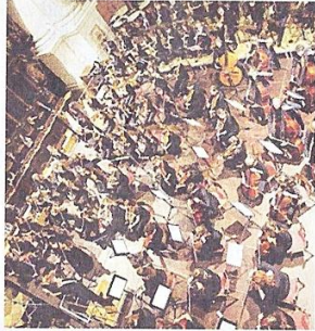
Jugendsinfonieorchester ÖÖ