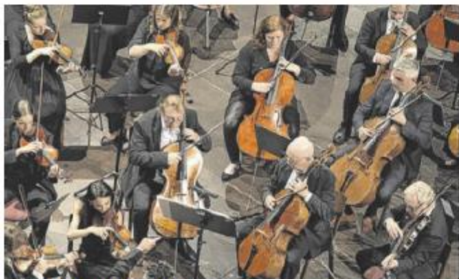
Das Altomonte Orchester spielt in St. Florian auf.