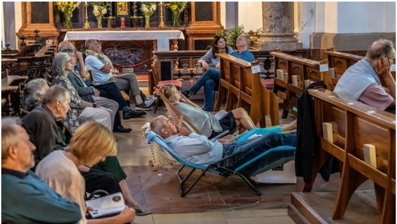
Orgelnacht auf Liegestühlen in der Stiftskirche

Orgelkunst mit Liegestuhl und Jandl-Liedern