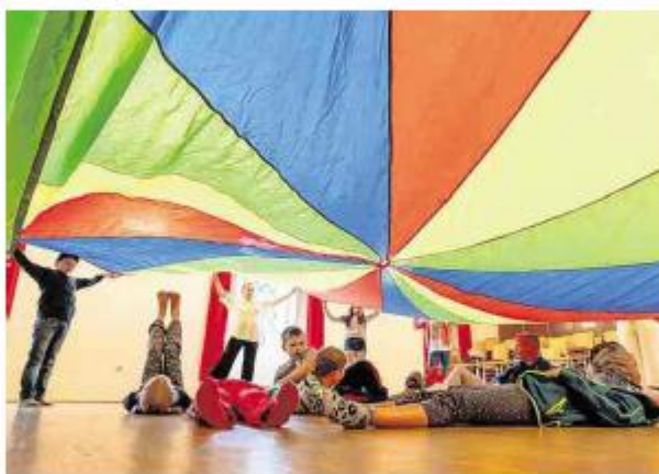
Bei den Jungen Brucknertagen in Linz geht es viel um das Erlebnis und das Spüren für die teilnehmenden Kinder.