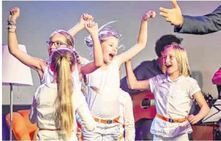
Die Jungen haben sichtlich ihre Freude mit Bruckner.