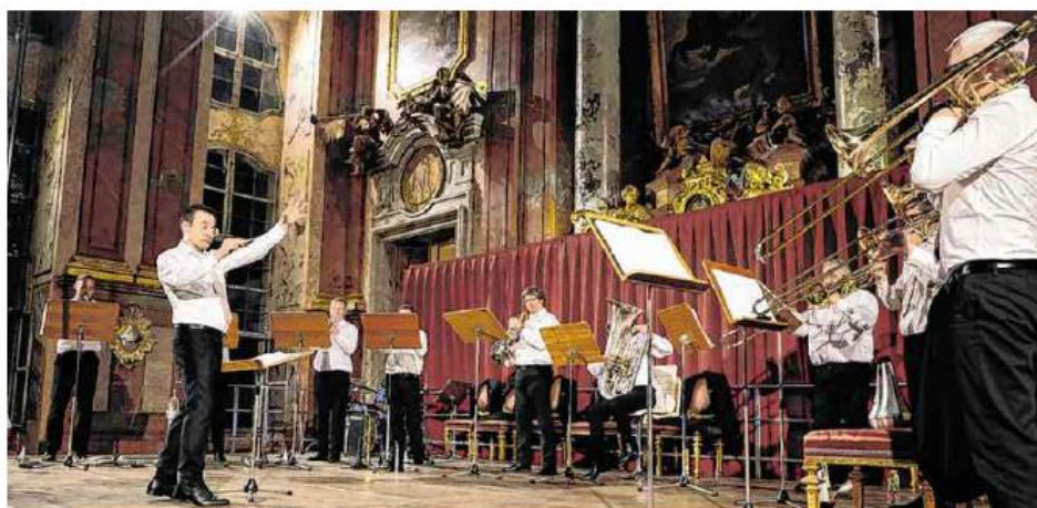
Eröffnungskonzert mit dem European Brass Collective am Sonntagabend im Marmorsaal des Stiftes